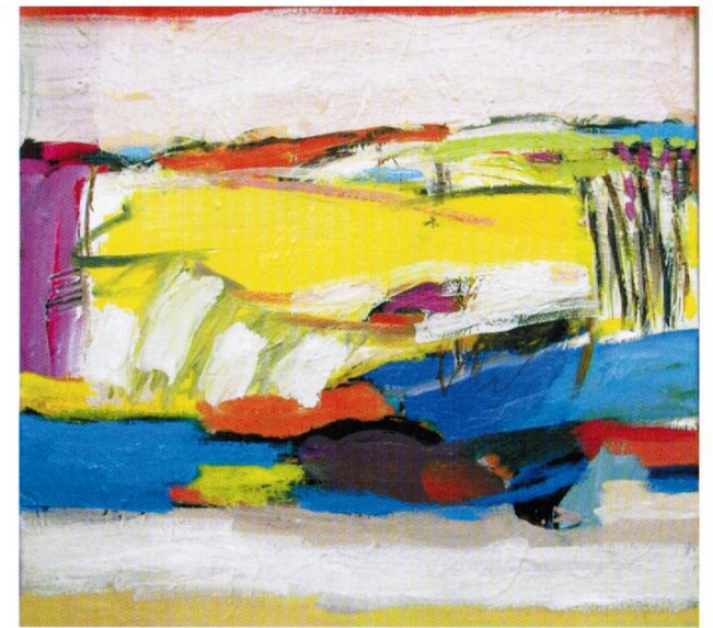
Marlis Glaser: Bild 1/2010 zu „ein Liebeslied“ - Öl a. Lwd., 50 x 50 cm

Zur Eröffnung und zum Besuch der Ausstellung sind Sie und Ihre Freunde herzlich eingeladen.