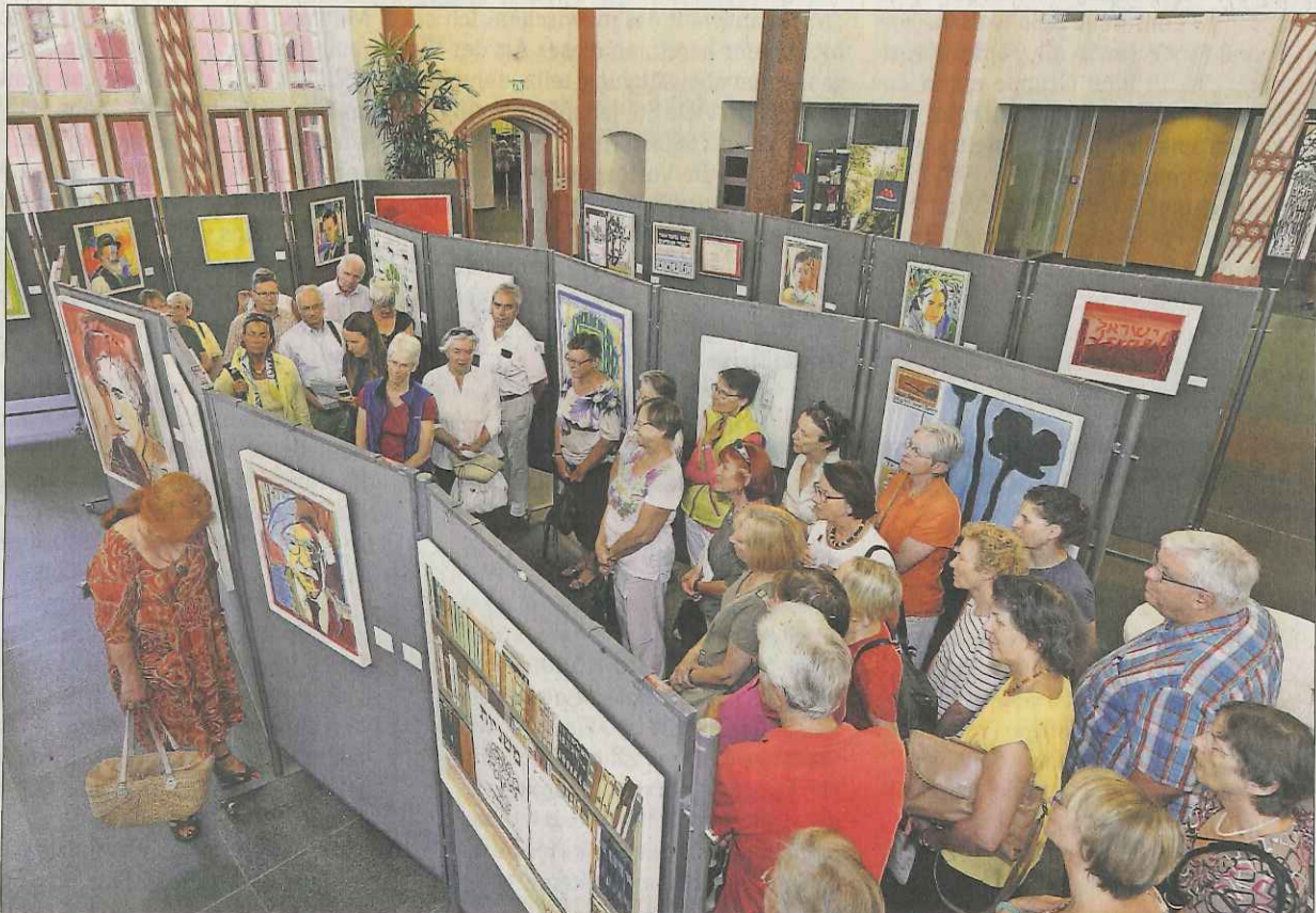
Einblicke: Die BZ-Gäste lernen eindruckliche Kunstwerke und die Persönlichkeiten dahinter kennen.

Mehr Fotos unter http://mehr.bz/ferienaktion-abraham