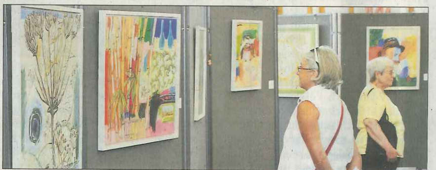
Bäume und Menschen – kunstvoll verknüpft im großen „Abraham-Projekt“.